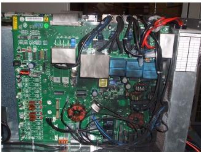
Foto 1: Falha do UPS devido a inserção de material diferente e condutivo

6) Reciclagem do operador: Uma vez que a maioria das interrupções de energia é resultado de erro humano, deve ser dada atenção constante para garantir que todo o pessoal com acesso ao UPS e comutadores associados tenham uma sólida compreensão do funcionamento do sistema e das conseqüências de quaisquer ações incorretas.