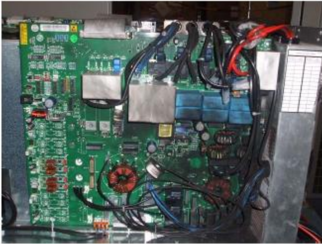
Foto 1: Falha do UPS devido a inserção de material diferente e condutivo

6) Reciclagem do operador: Uma vez que a maioria das interrupções de energia é resultado de erro humano, deve ser dada atenção constante para garantir que todo o pessoal com acesso ao UPS e comutadores associados tenham uma sólida compreensão do funcionamento do sistema e das conseqüências de quaisquer ações incorretas.